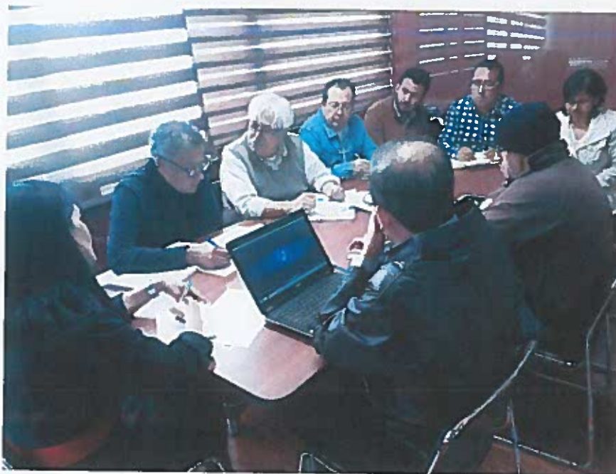
Director y personal de la Unidad Regeneración Urbana

Los acuerdos mantenidos en las reuniones generales, son comunicados al personal que labora en la Unidad de Regeneración Urbana, a través de mesas de diálogo. Asimismo, se analizan los temas pendientes y se asumen compromisos para el desarrollo de las actividades, todas estas acciones son informadas oportunamente a comunidad lojana.