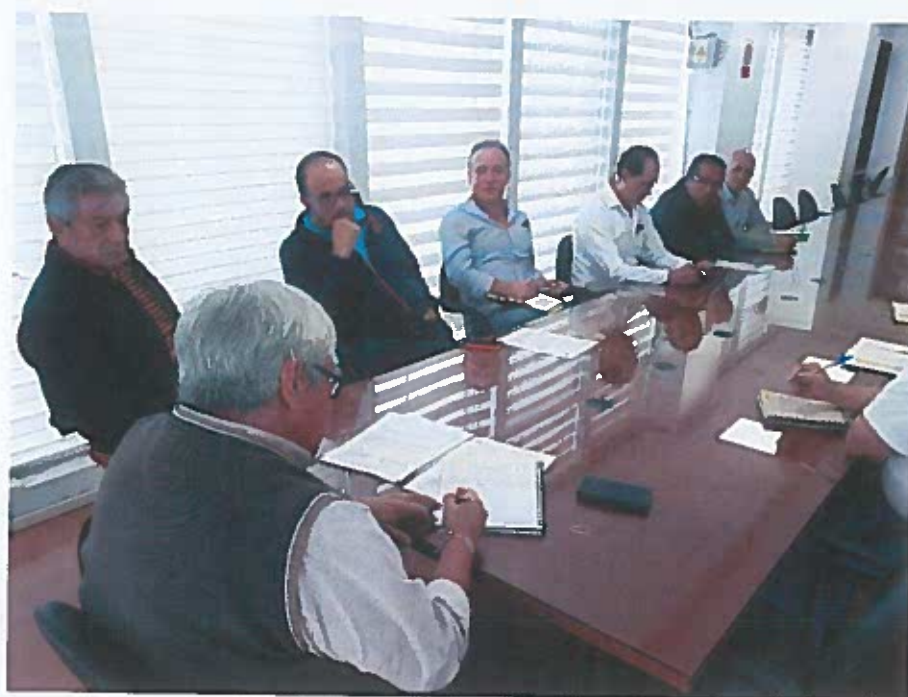
Reunión de coordinación, 25 de junio de 2019