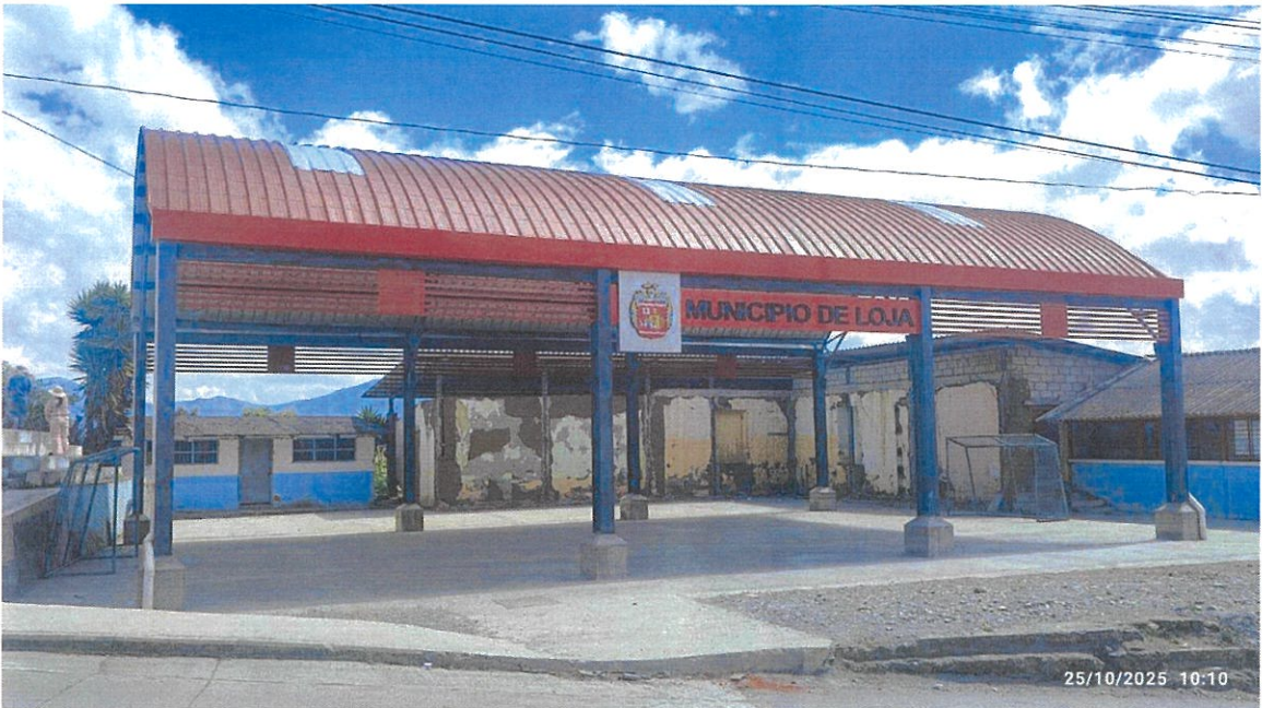
Cubierta en Área Comunal Bolonia