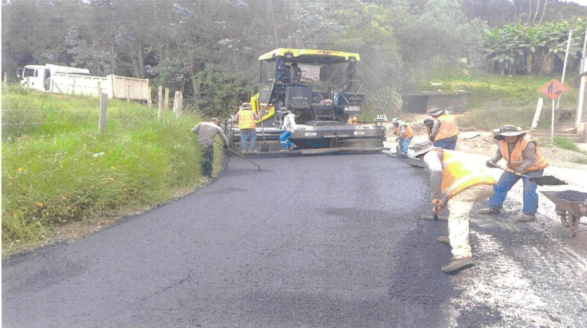
Mejoramiento de la vía a Chinguilanchi