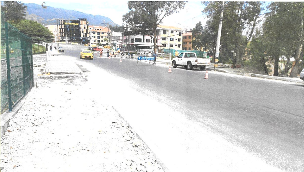
Puente Vehicular sobre el Río Malacatos en la Av. Reinaldo Espinosa