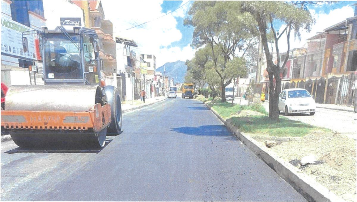
Recapeo con carpeta asfáltica de 2" de la Av. Manuel Carrión Pinzano