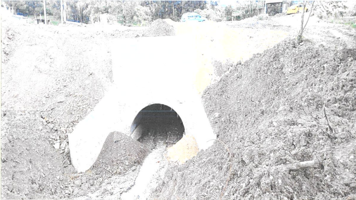
Alcantarilla Multiplaca En Quebrada Shushuwayco Del Barrio Vicente Rocafuerte