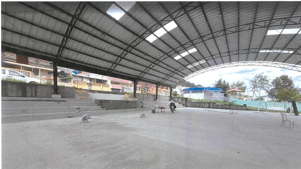
Cubierta Escuela La Pradera