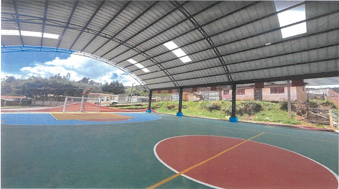
Cubierta del Barrio Víctor Emilio Valdivieso