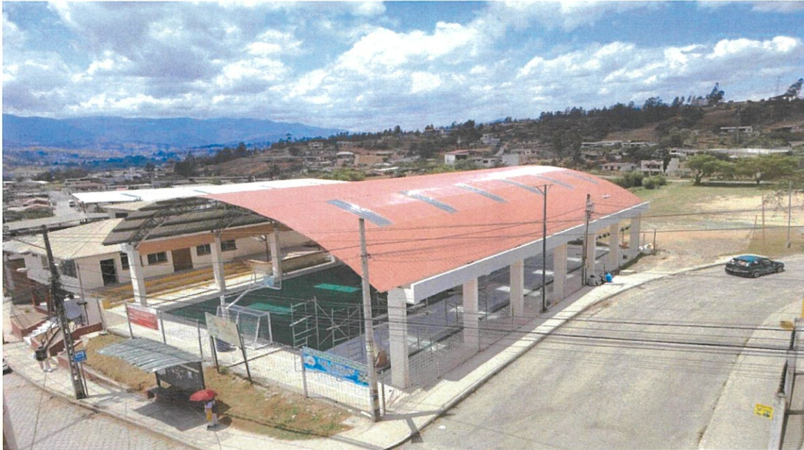
Cubierta para Área Deportiva del Barrio Motupe Bajo