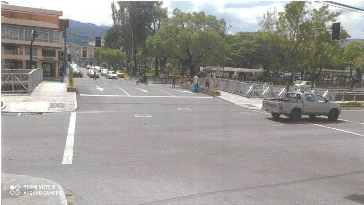
Puente Vehicular sobre el río Malacatos en la calle Imbabura