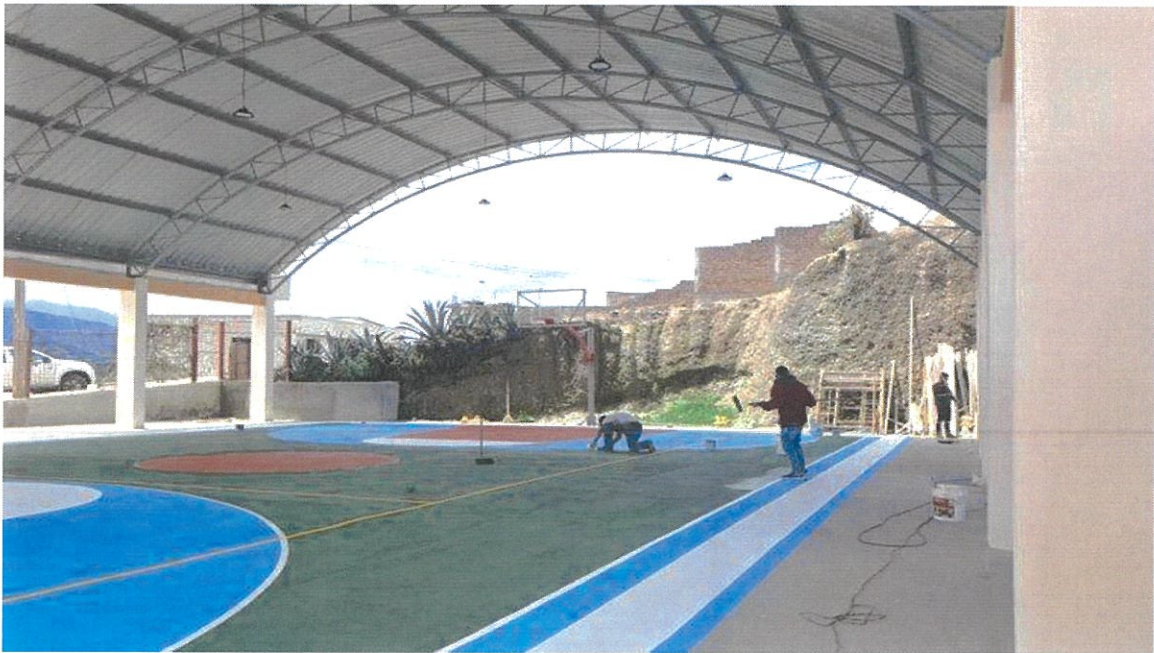
Cubierta Escuela Capulí Loma