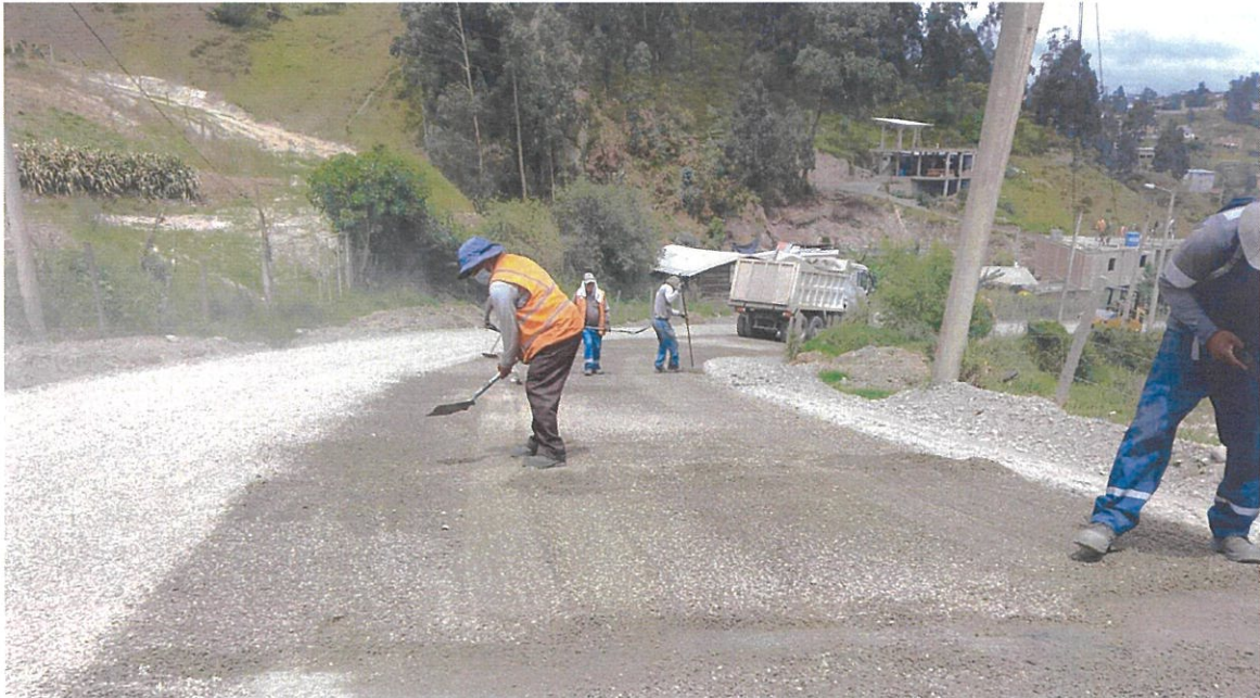
Mantenimiento de larga duración de la Av. Shushuayco entre Valladares y Av. Villonaco,